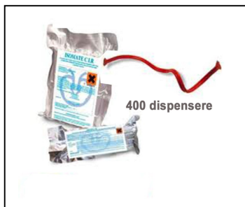
Indhold: 400 stk./pakke

Ophænges i starten af maj før flyvning af viklere. Brug handsker.