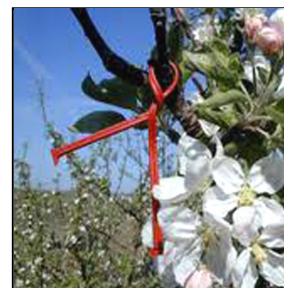
Vikles om høj gren/tråd

Virker mod: Æblevikler Frugtskrælvikler Chokoladebrun bladvikler Skarpspidset bladvikler Hækvikler